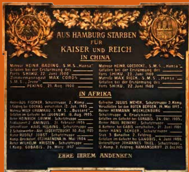
Gedenktafel in der Hamburger Hauptkirche St. Michaelis zu Ehren der in Kolonialkriegen getöteten deutschen Soldaten Titelbild: Das 1939 errichtete „Deutsch-Ostafrika-Kriegerdenkmal“ auf dem Gelände der ehemaligen Lettow-Vorbeck-Kaserne in Hamburg-Jenfeld